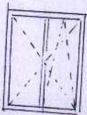
OKNO szt 1

Jacek Vincenty Zięba Inspektor Nadzoru nad Specjalnych Nr upr.bud. 5071/65/81